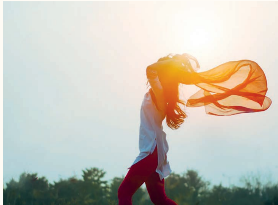
Komplementärmedizin eignet sich gut, um Selbstheilungskräfte zu aktivieren.

Bei einer Schnittwunde reagiert der Organismus beispielsweise physiologisch mit der Blutgerinnung. Dabei wird aber die Selbstheilung durch etwas Übergeordnetes gelenkt, orchestriert. In den Fachrichtungen der Komplementärmedizin spricht man in der anthroposophischen Medizin von der Ich-Organisation, in der Traditionellen Chinesischen Medizin von Qi und Tao, in der Klassischen Homöopathie von Lebenskraft.